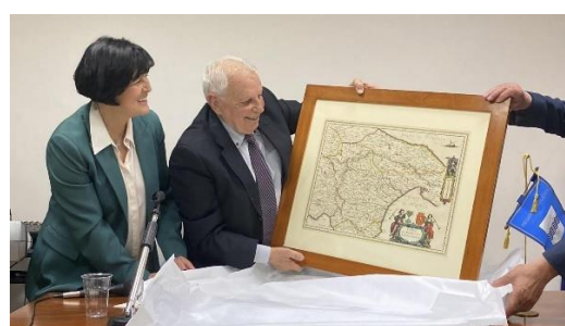
Insediamiento e presentazione Consiglio e Cariche sociali, Saluti e Omaggio al Presidente uscente